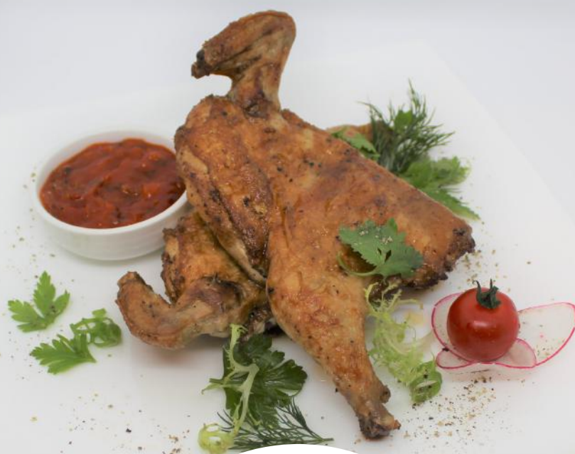
ПОВЕЗ ИЗ КУРЯТНИКА цыпленок, соус сальса 300/40/20гр