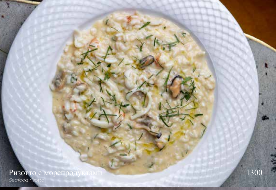
Ризотто с морепродуктами Seafood risotto