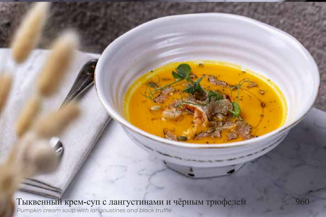
Тыквенный крем-суп с langoustинами и чёрным трюфелем

Pumpkin cream soup with langoustines and black truffle