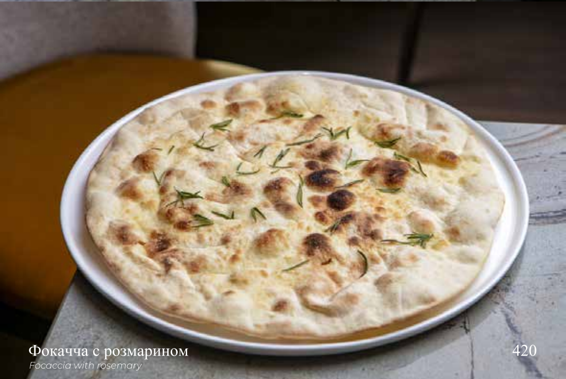
Фокачча с розмарином Focaccia with rosemary