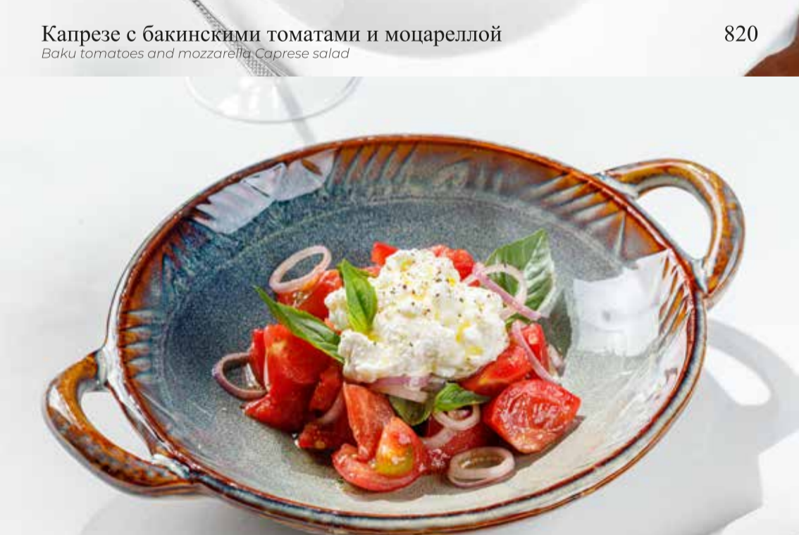
Томаты с рикоттой и луком шалот