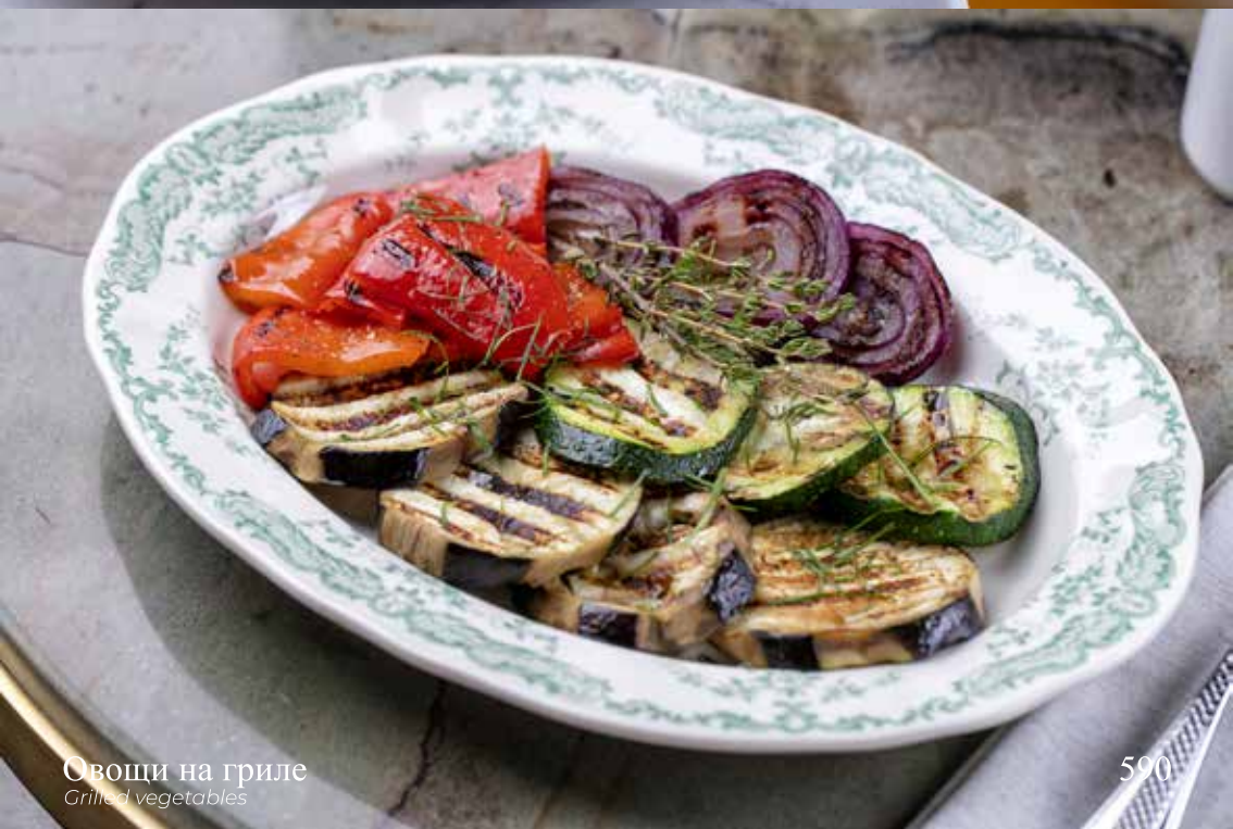
Овощи на гриле