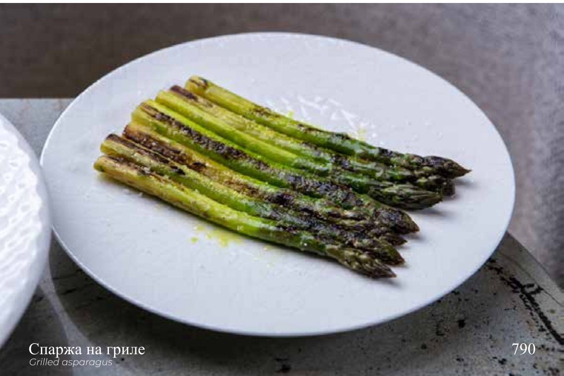
Спаржа на гриле