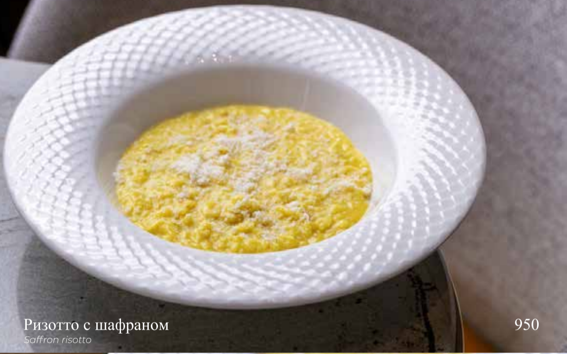
Ризотто с шафраном Saffron risotto