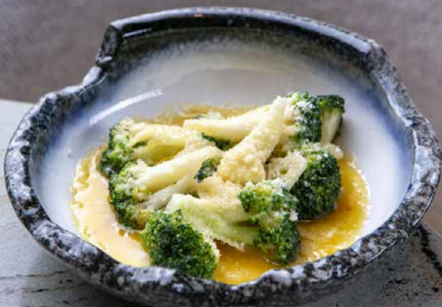
Брокколи с чесноком и пармезаном Ripassati langoustines with spinach and garlic