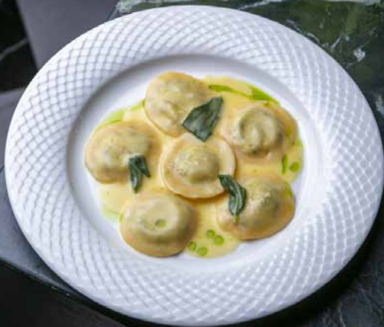
Равиоли с рикоттой и шпинатом Ricotta and spinach ravioli