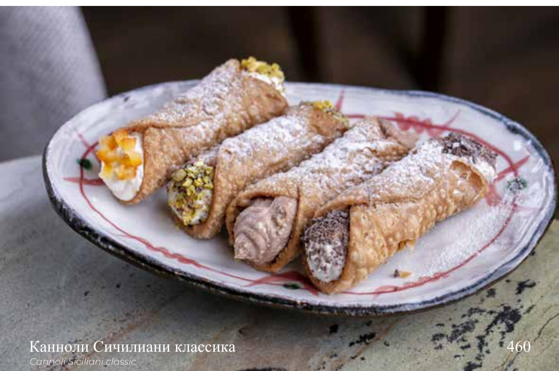
Канноли Сичилиани классика