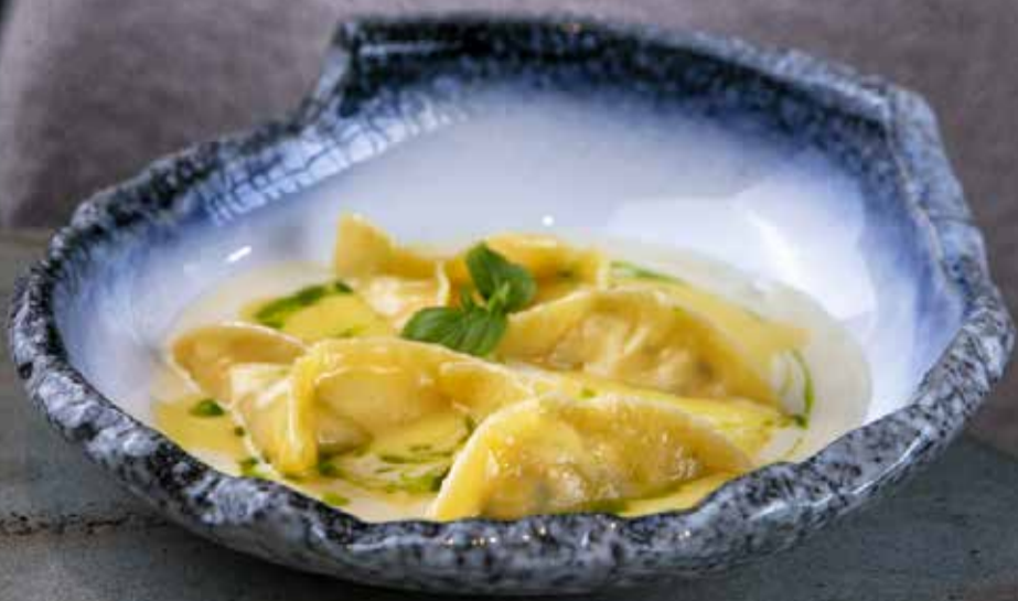
Равиоли с крабом Crab ravioli