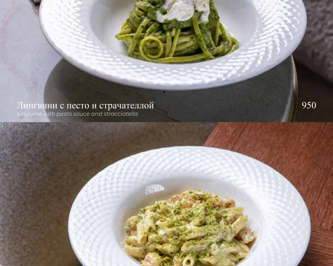
Лингвини с песто и страчattelлой

Linguine with pesto sauce and stracciatella