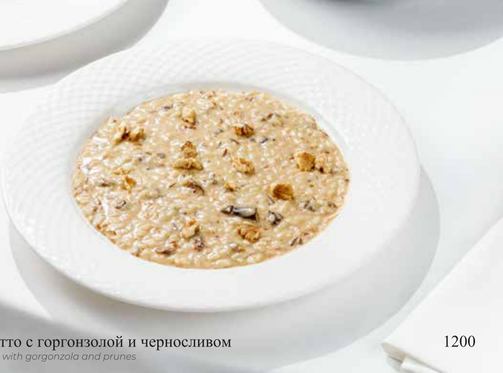
Ризотто с горгонзоллой и черносливом Risotto with gorgonzola and prunes