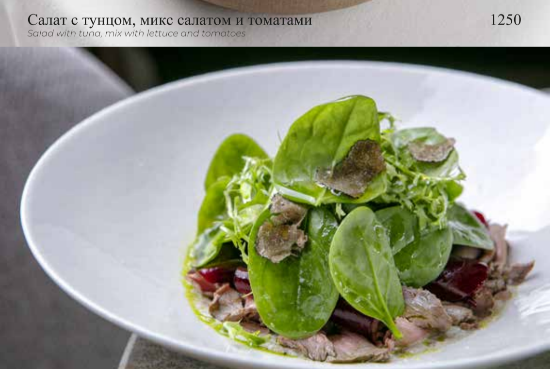
Ростбиф с запечённой свёклой и чёрным трюфелем

Beef roast with baked beet and black truffle