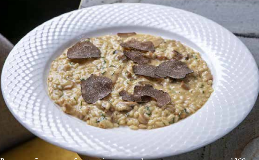
Ризотто с белыми грибами и чёрным трюфелем Porcini mushrooms and black truffle risotto