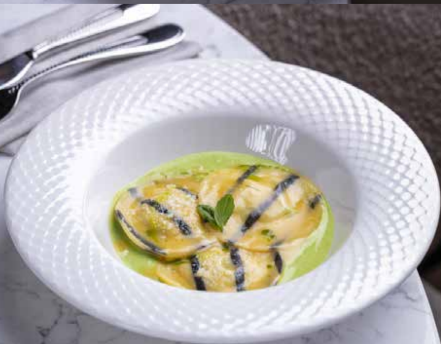
Равиоли с креветками Shrimp ravioli