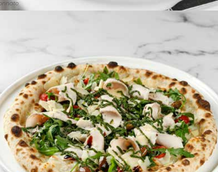
Пицца с курицей