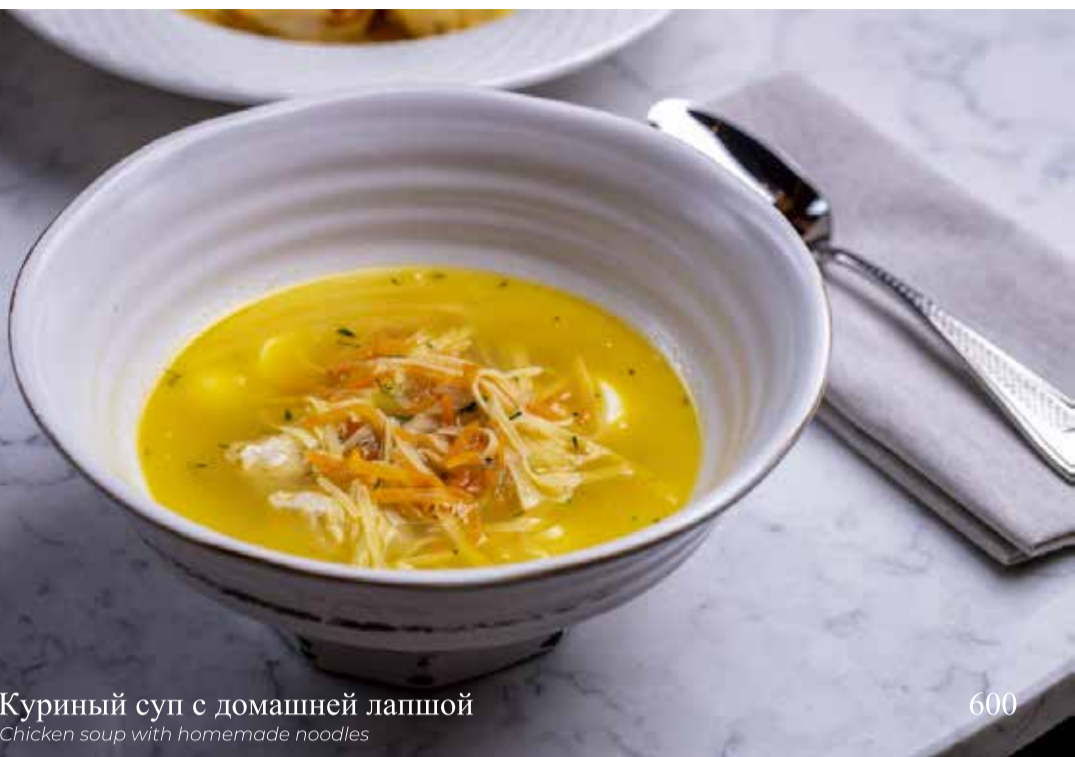
Куриный суп с домашней лапшой