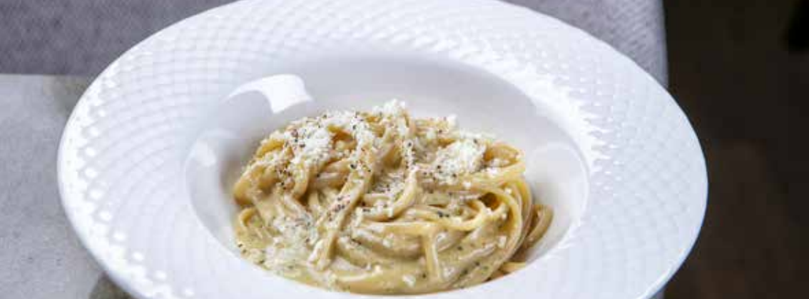
Лингвини Качо э Пепе