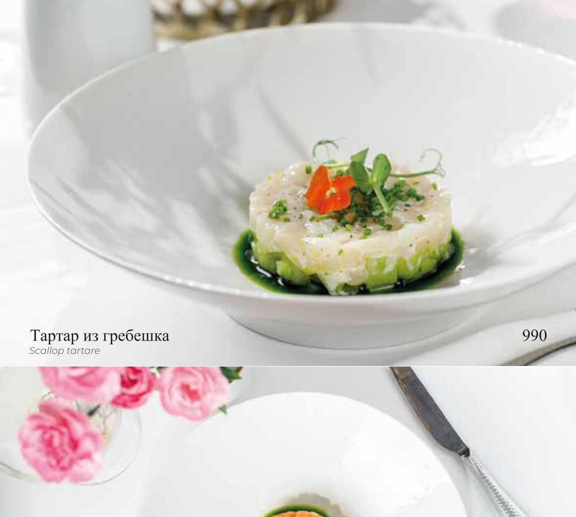
Тартар из гребешка