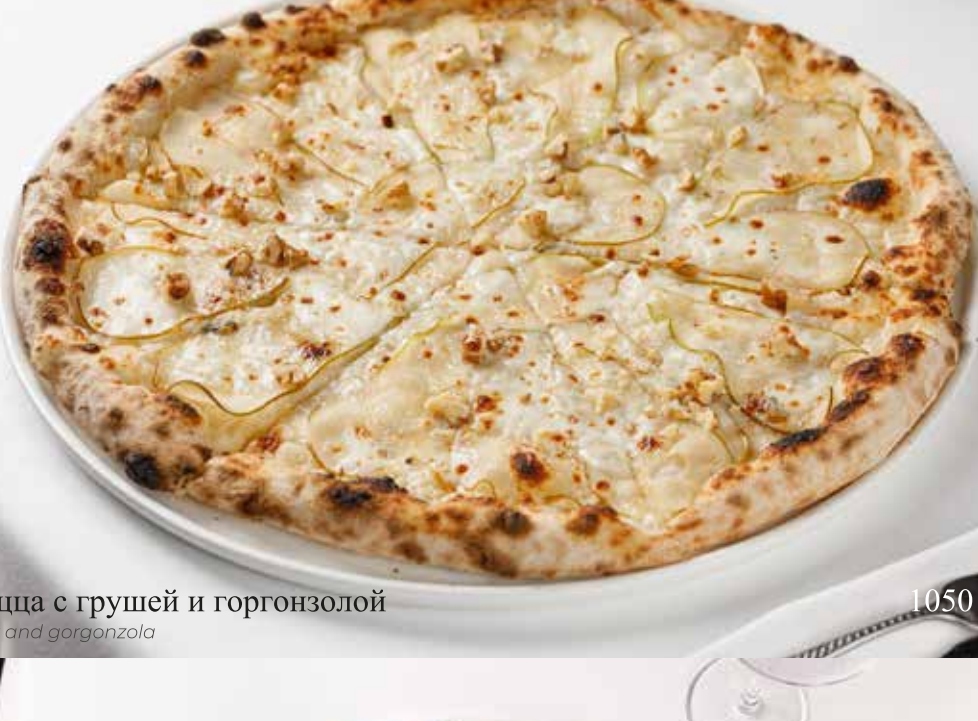
Пицца с грушей и горгонзолой