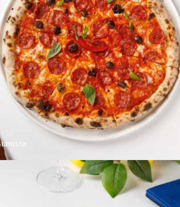
Пицца Алла диавола