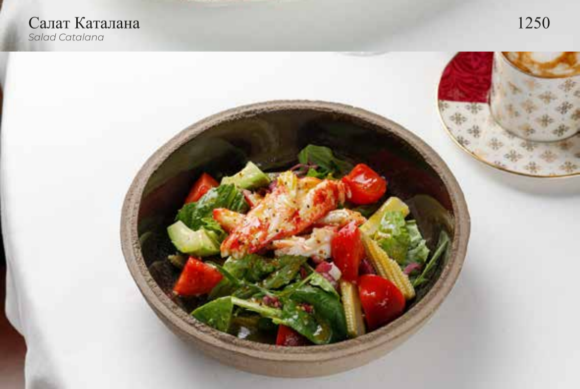
Салат с крабом и початками кукурузы