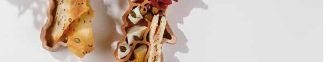
Перец Рамиро с рикоттой и анчоусами

Pepper Ramiro with ricotta and anchovies