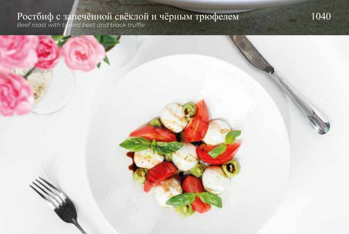
Капрезе с бакинскими томатами и моцареллой

Baku tomatoes and mozzarella, Caprese salad