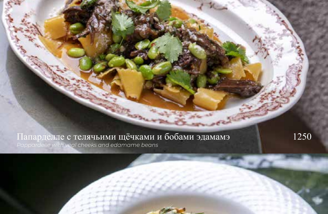
Папарделле с телячьими щёчками и бобами эдамамэ

Pappardelle with veal cheeks and edamame beans