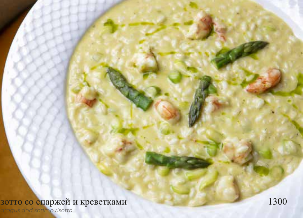
Ризотто со спаржей и креветками Asparagus and shrimp risotto