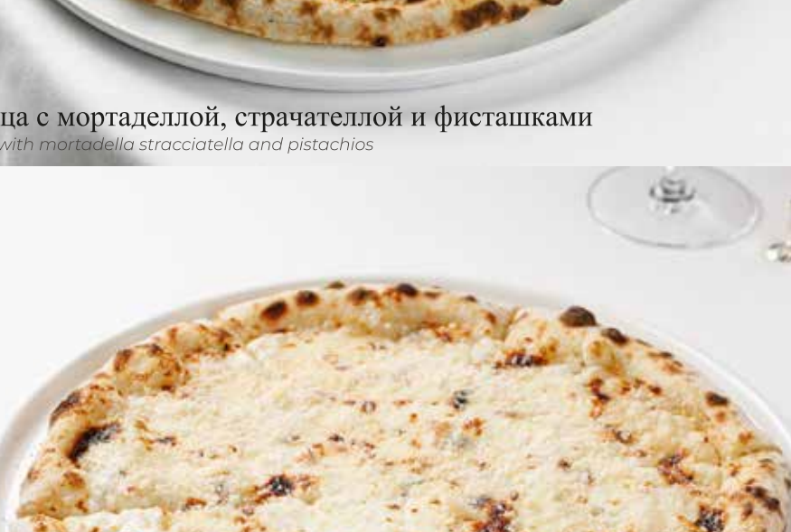
Пицца 4 сыра