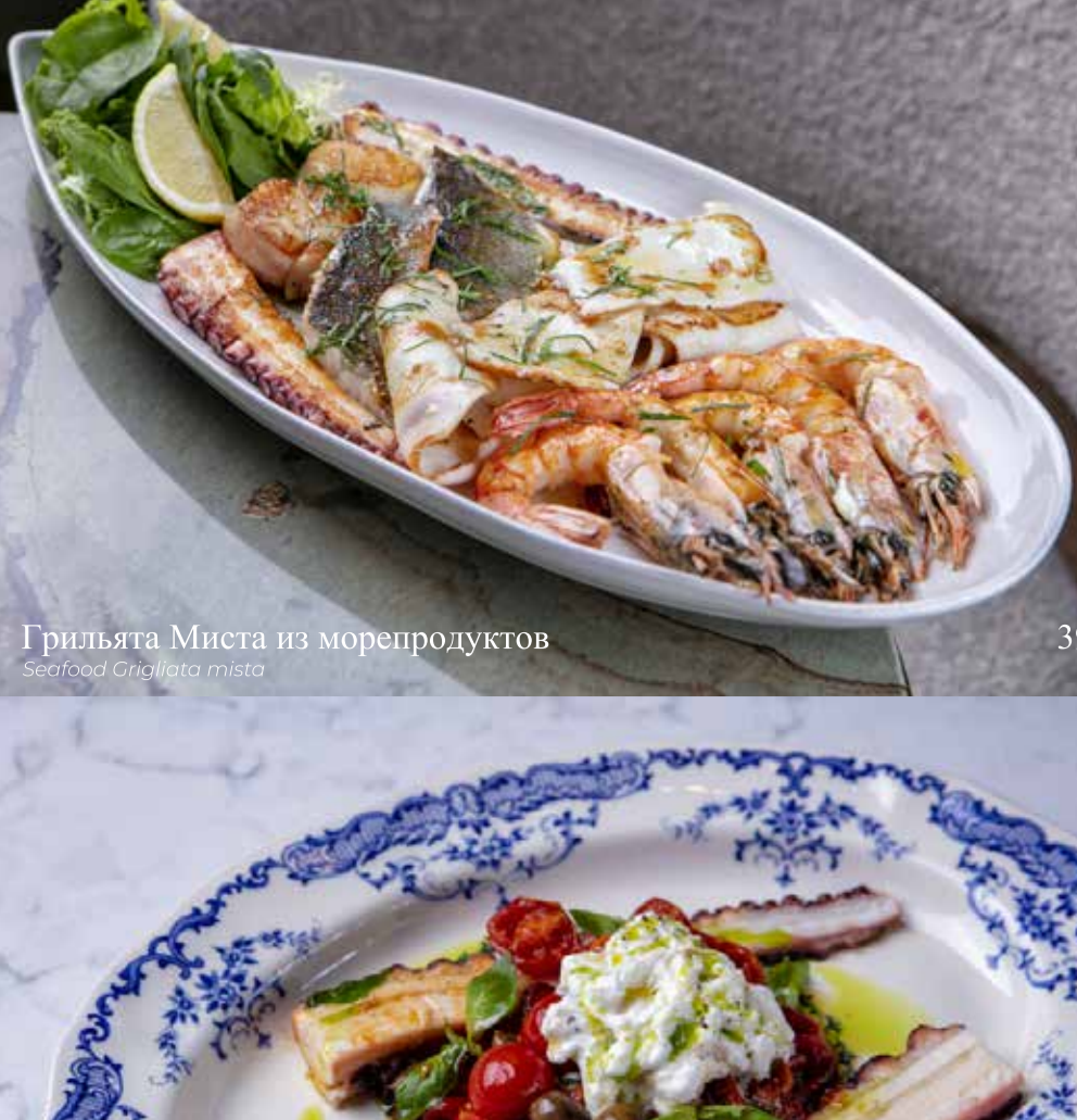
Грильята Миста из морепродуктов