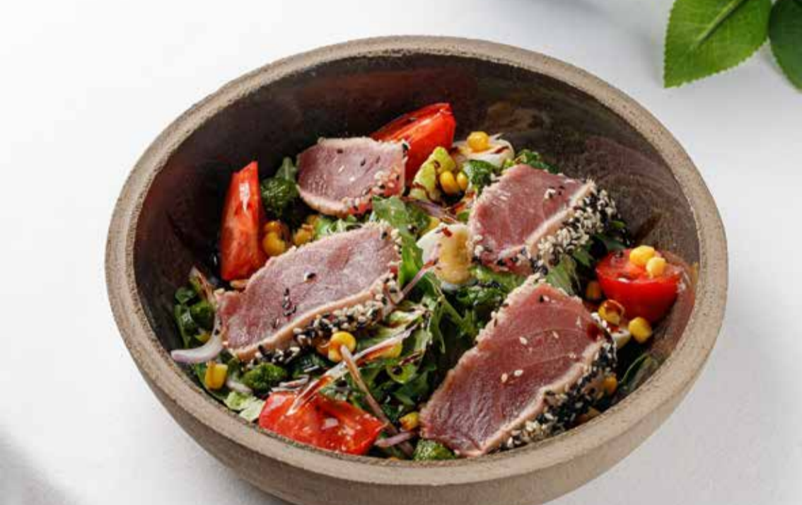
Салат с тунцом, микс салатом и томатами

Salad with tuna, mix with lettuce and tomatoes