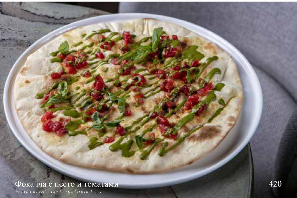
Фокачча с песто и томатами Focaccia with pesto and tomatoes