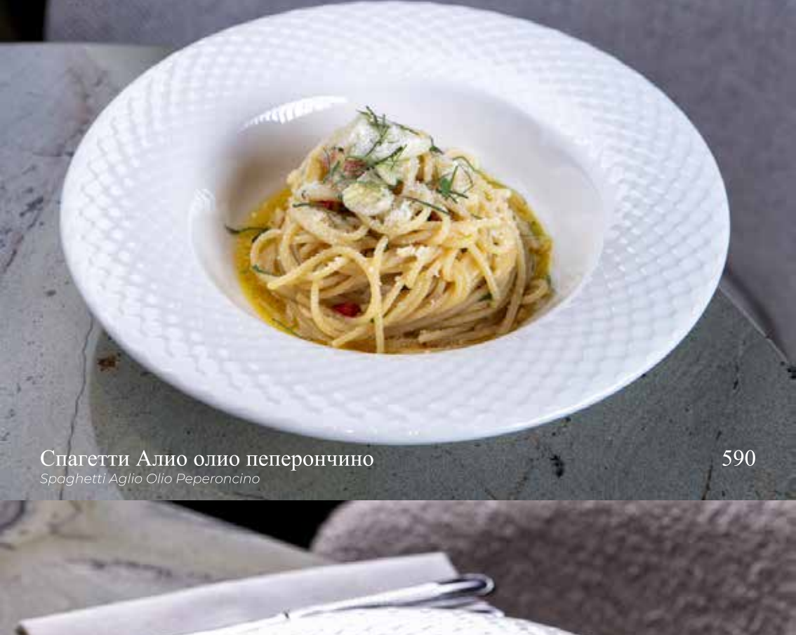
Спагетти Алио олио пеперончино