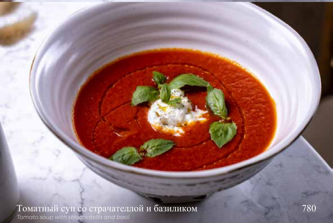
Томатный суп со страчателлой и базиликом

Tomato soup with stracciatella and basil