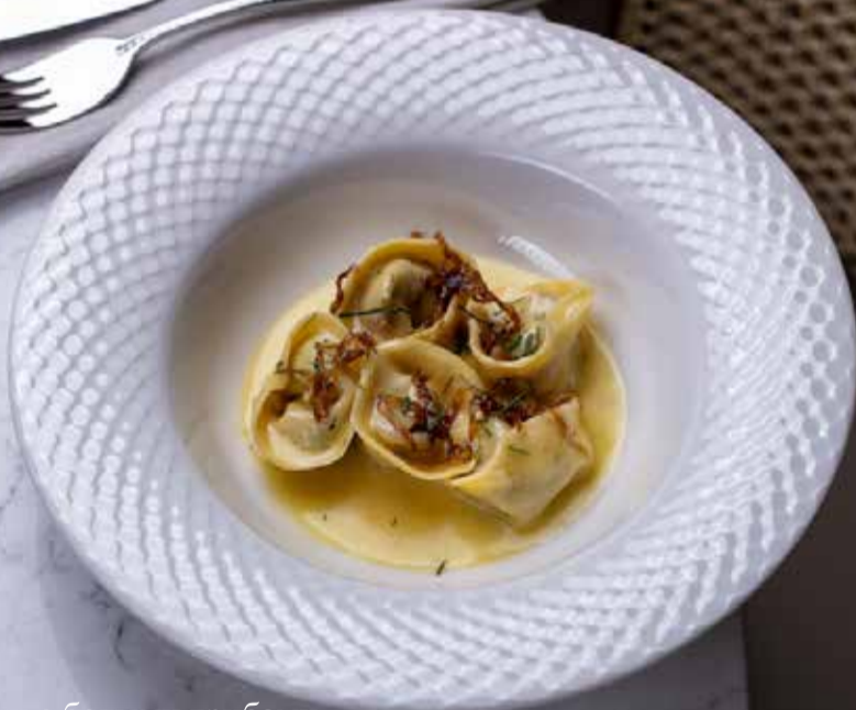
Равиоли с белыми грибами Porcini mushroom ravioli