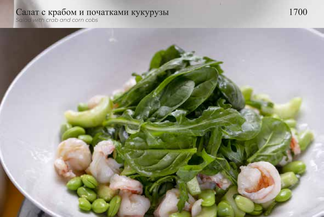
Салат с креветками, огурцами и бобами эдамамэ

Shrimp, cucumbers and edamame beans salad