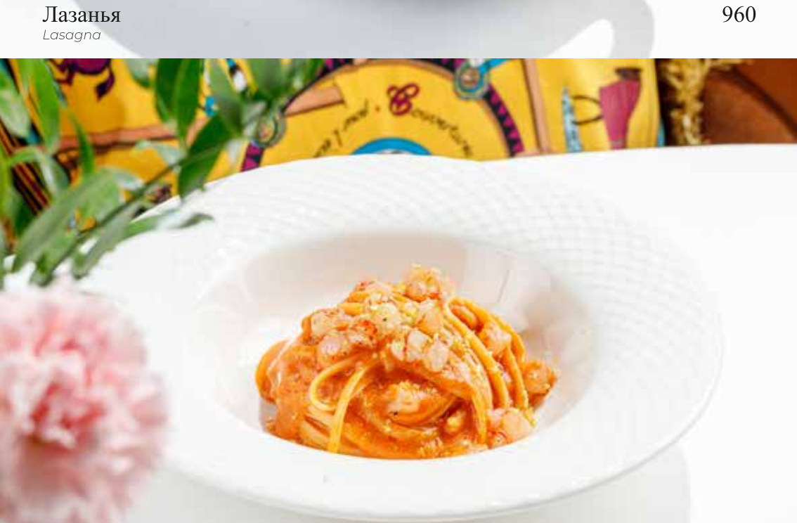
Лингвини с морским ежом