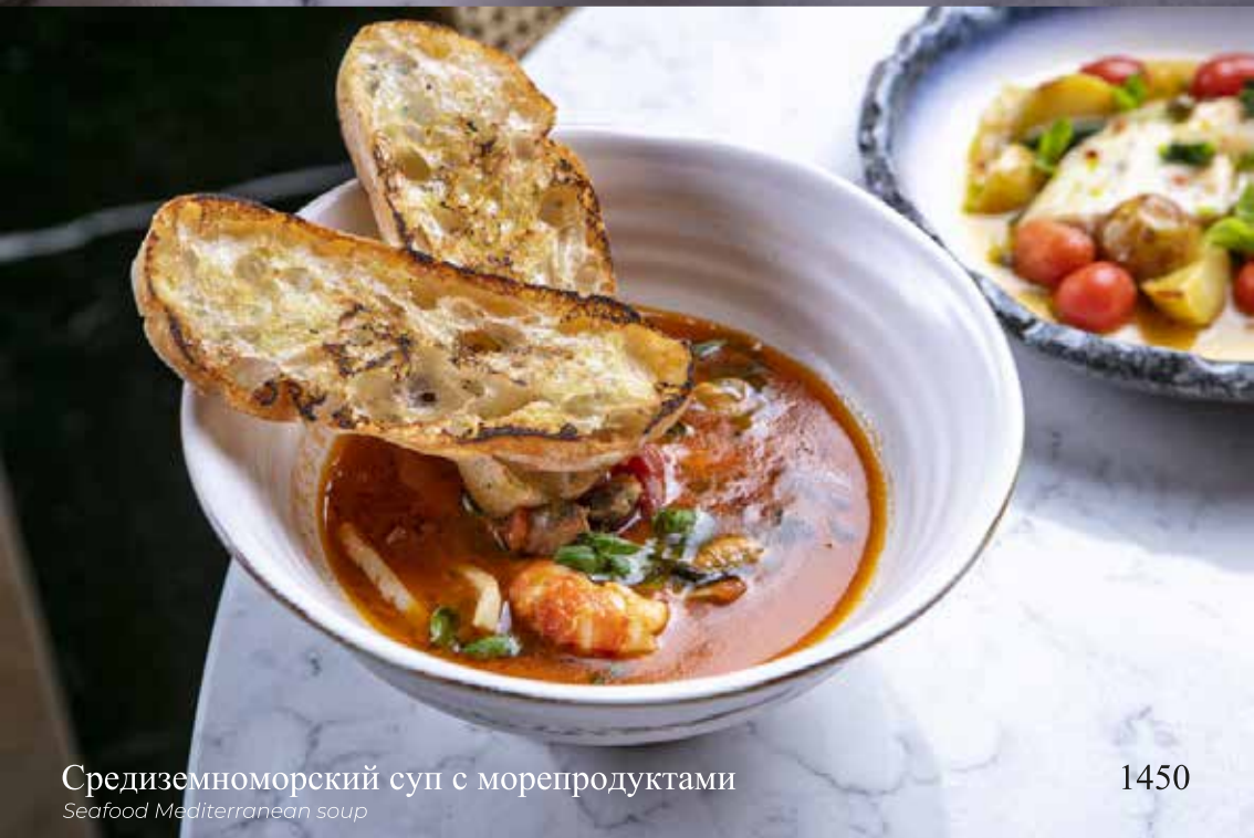
Средиземноморский суп с морепродуктами