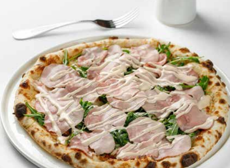
Пицца Вителло Тоннато