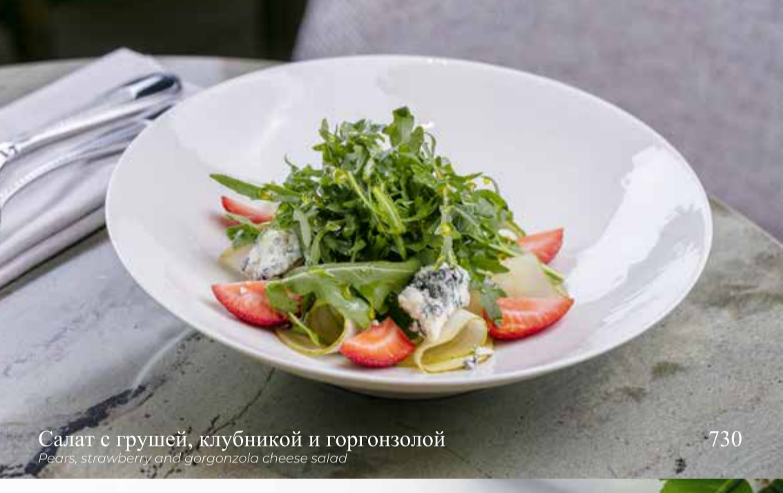
Салат с грушей, клубникой и горгонзоллой

Pears, strawberry and gorgonzola cheese salad