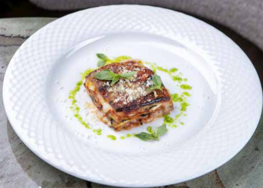
Баклажан Алла пармиджана Garlic and parmesan broccoli