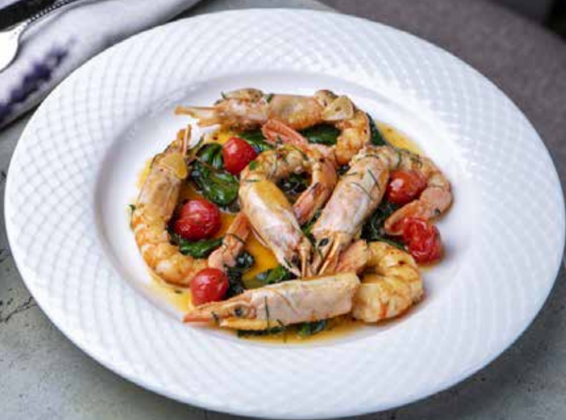
Лангустины рипассати со шпинатом и чесноком Stuffed calamari with langoustines