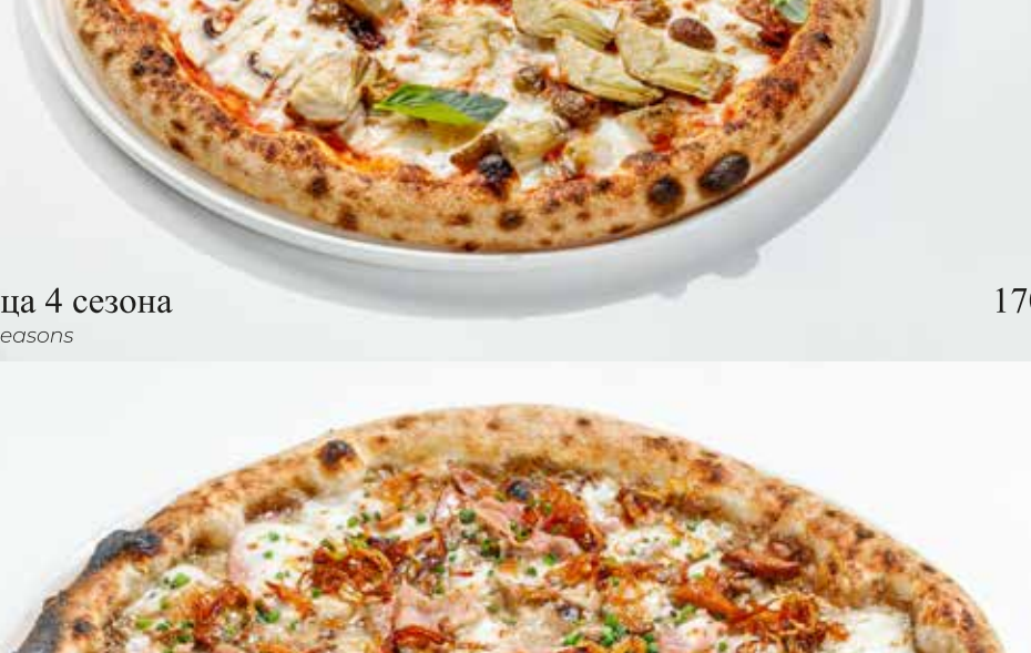
Пицца с белыми грибами и прошутто котто