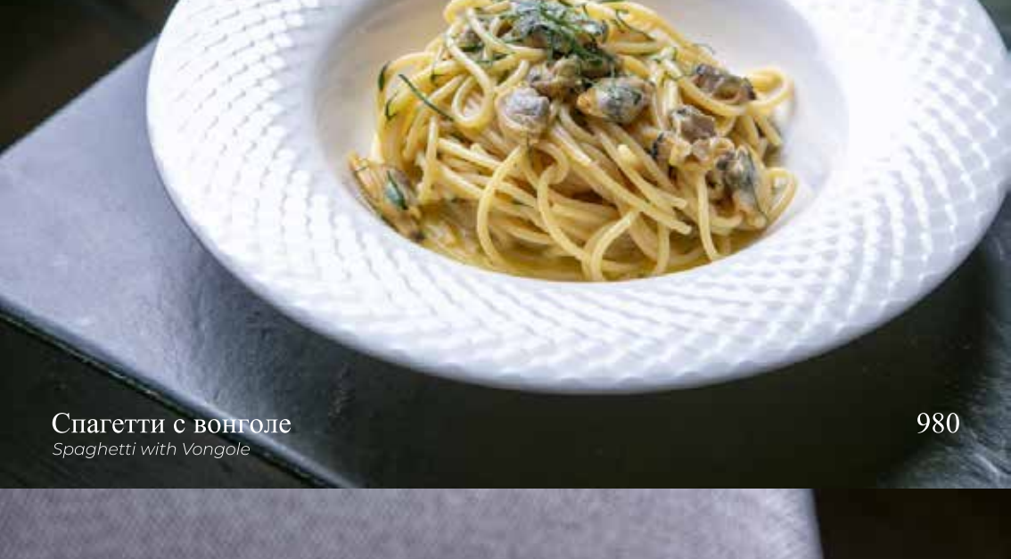
Спагетти с вонголе