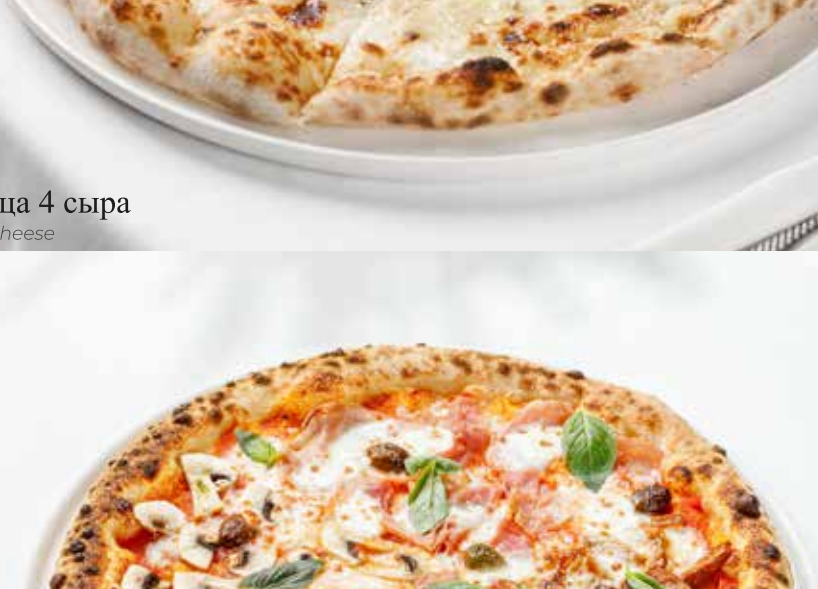
Пицца 4 сезона