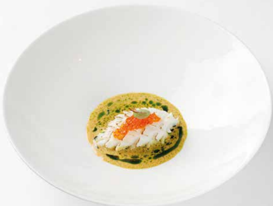
Фаршированный кальмар с лангустинами Alla parmigiana eggplant