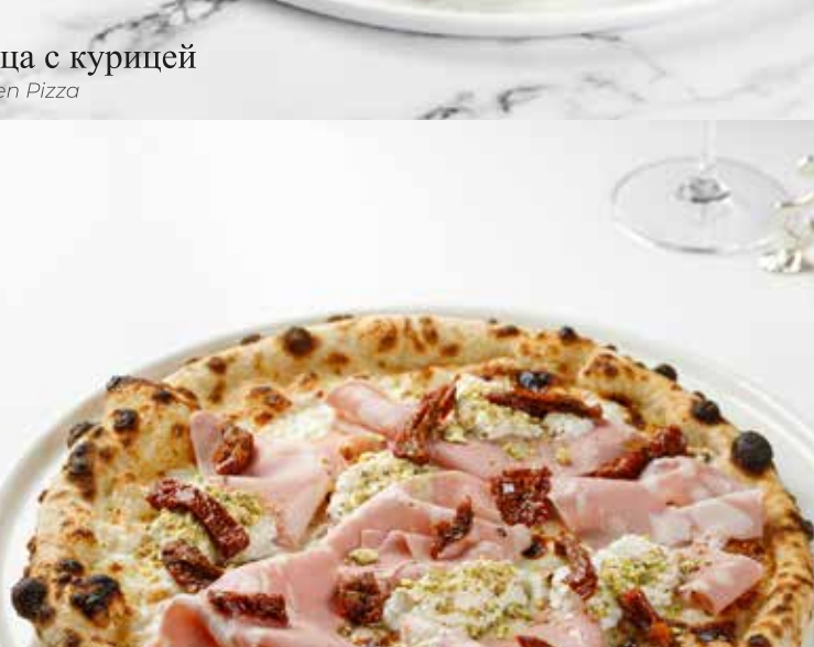
Пицца с мортаделлой, страчателлой и фисташками

Pizza with mortadella stracciatella and pistachios