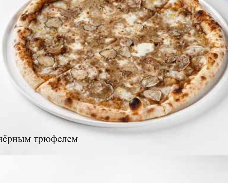
Пицца с чёрным трюфелем